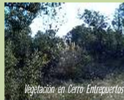
Vegetación en Cerro Entrepuertos

Opción A: Giramos a la derecha en dirección Sur hasta encontrar a unos 900 metros la Casa del Hierro, atravesando una zona de encinas de magnífico porte. Desde esta casa tomamos el camino de la Casa del Hierro en dirección Oeste, cruzamos el Arroyo del Barranco de la Turca, hasta llegar a la Casa de las Ventas. Giramos a la izquierda y deberemos cruzar la Rambla por una zona por donde el nivel del agua nos permite observar especies como el ánade real o azulón, fochas comunes y algún que otro aguilucho lagunero. A poco más de un kilómetro encontraremos la Carretera de Santa Cruz que tomaremos hacia la izquierda para volver de regreso a Moral.