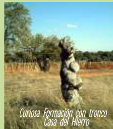
Curiosa Formación con tronco Casa del Hierro

Tras descender alrededor de 1,2 km llegamos a la Rambla de Santa Cruz, que vadeamos y giramos hacia la izquierda, tomando el Camino Real de Almagro a Santa Cruz de Mudela, éste camino en algunos tramos es conocido como el Camino de la Plata. Algunos ilustres viajeros se sabe que pasaron por este camino como Carlos V en un traslado de Andalucía a Toledo, en el año 1526.