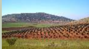
Los campos de cultivo nos acompañan En gran parte del recorrido

Avanzamos hacia el Sur atravesando una zona de viñas y olivar para encontrarnos con la bifurcación que se forma con el Camino de Doña Elvira, seguimos por el de la izquierda (dirección sureste) Llegamos al cruce