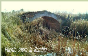
Puente sobre la Rambla

Seguimos hacia adelante por el Camino Real de Calzada, y al llegar al quinto camino a la izquierda, giramos hacia el Sur por el camino de Doña Elvira, para pasar entre dos lomas (el Cerro Cabeza Parda y la Cuerda del Lantiscar).