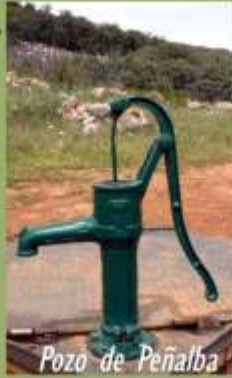
Pozo de Peñalba

Tomando la Cañada de Santiago hacia la izquierda, en dirección Este, hasta llegar a la carretera de Valdepeñas, nos encontraremos el pequeño puente por el que confluyen el Arroyo Colorado , que viene del