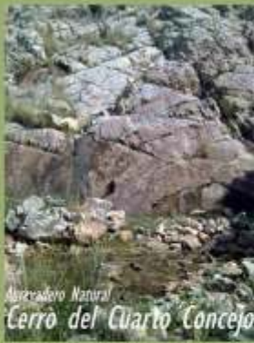
Alcornoque Natural Cerro del Cuarto Concejo

La ruta de las “Lagunas y Peñalba” resulta interesante por los lugares por donde pasa y los recursos que se observan. Se visita una de las lagunas endorreicas del municipio utilizando recorridos históricos por vías pecuarias, así como los arroyos que llenan estas lagunas en años de abundancia hídrica. También esta ruta, nos lleva hasta un lugar de gran belleza paisajística del entorno de Moral de Calatrava, Peñalba.