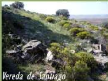
Vereda de Santiago

Antes de girar por esta, podemos avanzar algo más para poder llegar a observar el vaso lagunar de Calderón , otra de las lagunas de origen volcánico. Esta laguna, también cultivada en su gran parte de cereal, se encuentra rodeada por olivares y viñas.