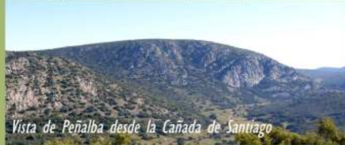
Vista de Peñalba desde la Cañada de Santiago

Una vez se pasado el Cerro del Cuarto Concejo sale, perpendicularmente a nuestro encuentro, un pequeño sendero en dirección Norte, la Senda de Manjalasvacas, la cual cruzaremos para seguir, en dirección Este, caminando por la Cañada de Santiago hasta llegar hasta el Pozo de