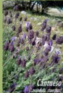
Cantueso ( Lavandula stoechas )

Peñalba, donde los lugareños tienen costumbre de recoger agua para llevar a sus hogares.